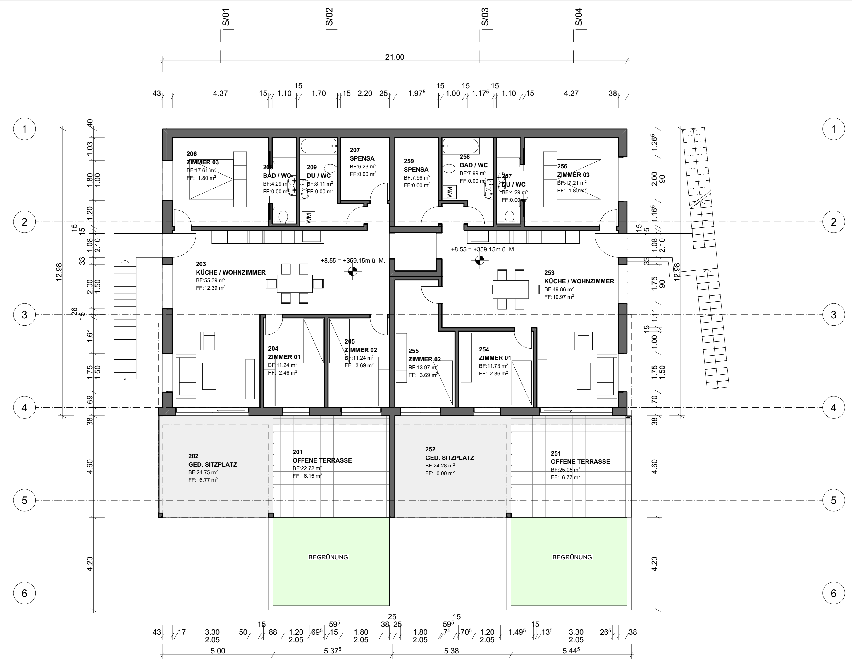
3. 2. OG 1:100