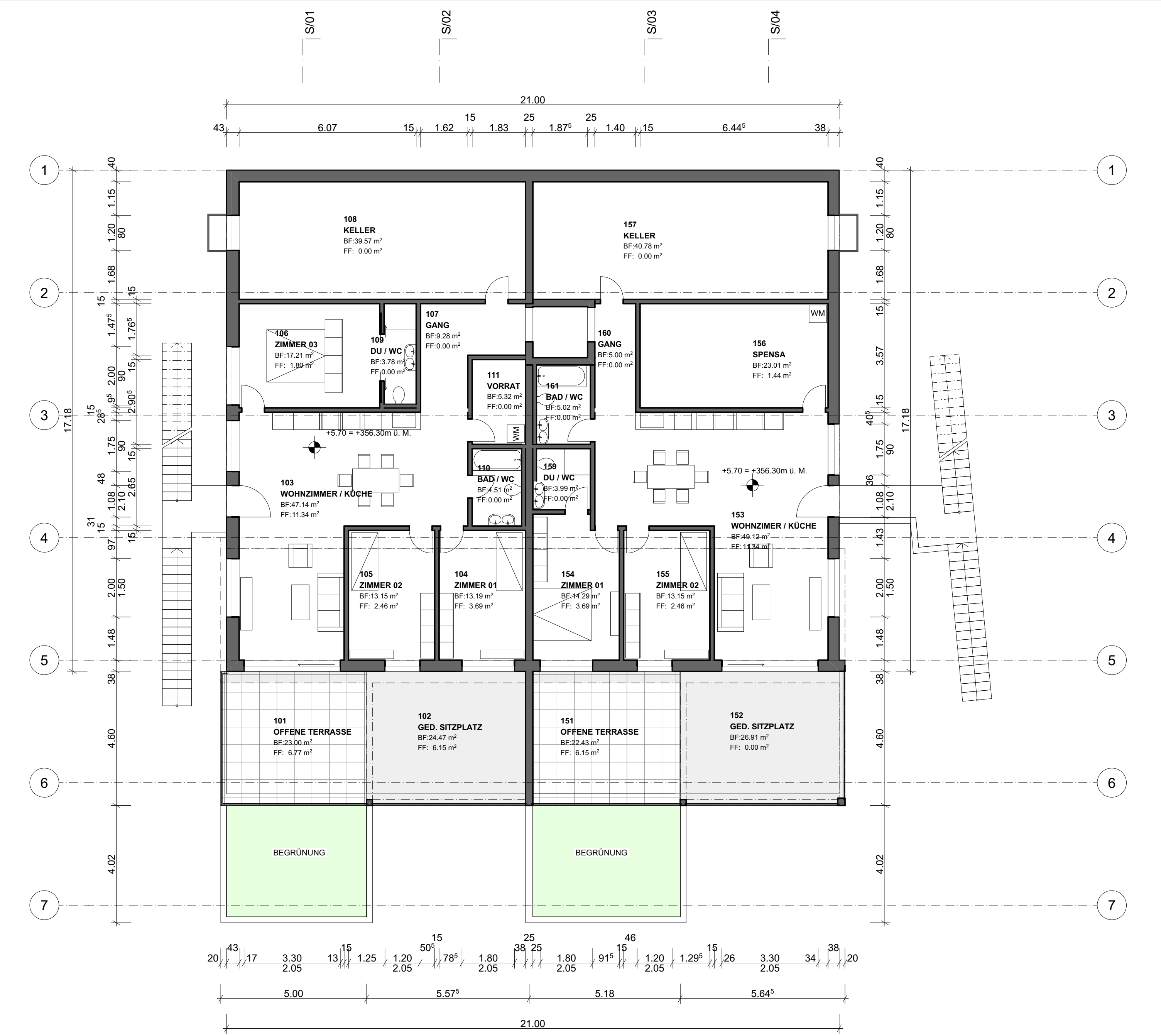
2. 1. OG 1:100